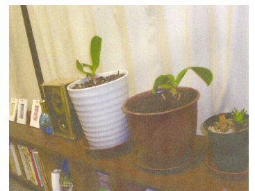
駒込事務所でも育ち続けました最後のYY祭に卒業生から頂いたプレゼント、大切に守っています