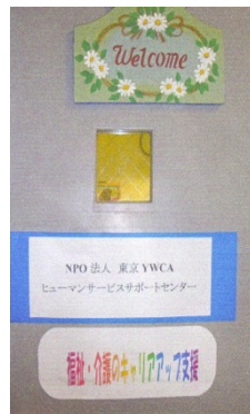
かつて学校時代に使っていた「時計」や「welcome」も動き始めました。写真は「扉」です