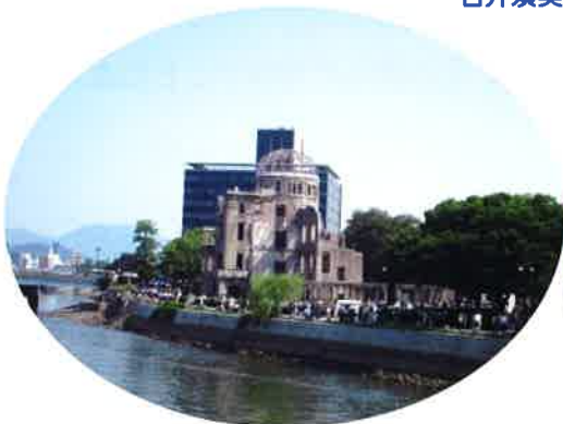
広島原爆ドーム・禎子の像