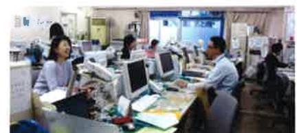
北区社協 地域福祉係事務室

当センターの派遣講師からも、受講される方々は「みなさん大変熱心で意欲があり、研修のやりがいを感じる」との声を聞いています。