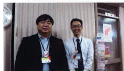
インタビューに答えてくださったお二人

この活動をとおして、地域の現状や福祉・介護などについて理解を深めてもらえるよう、事業に積極的に取り組み、そのサポートスタッフの育成・研修に力をいれています。